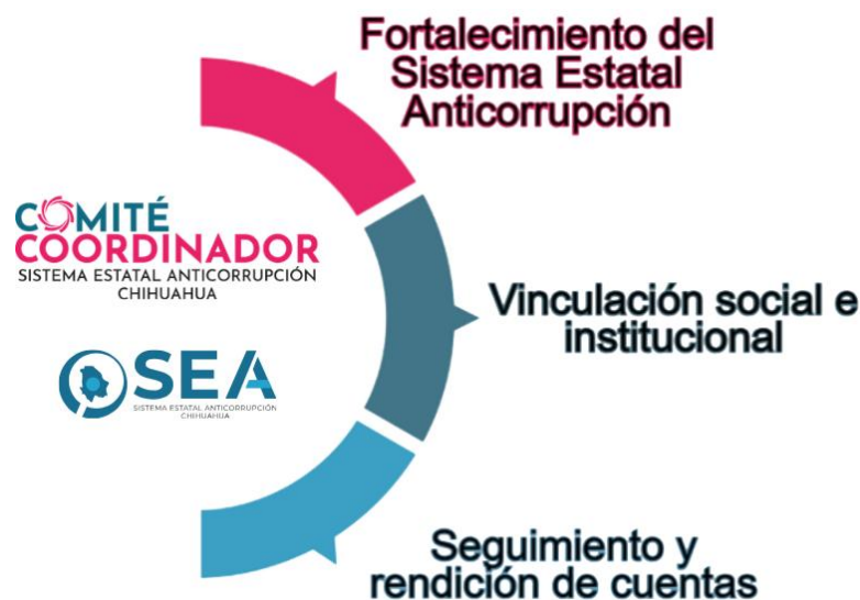
Figura 1. Ejes del Programa Anual de Trabajo 2025 del Comité Coordinador.

Asimismo, las acciones contenidas en el PTA 2025 se alinearon con las dispuestas en la Política Estatal Anticorrupción (PEA), teniendo impacto directo en los indicadores nacionales del Sistema Nacional Anticorrupción (SNA).