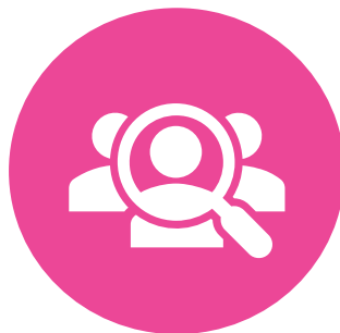
SERVIDORES PÚBLICOS EN CONTRATACIONES